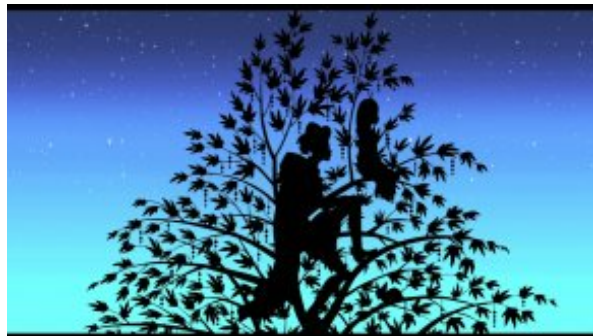
Azur et Asmar

Un fragment éblouissant de l'histoire du cinéma à découvrir en version restaurée, numérisée et racontée, qui favorise l'accès à l'œuvre dès 7/8 ans.