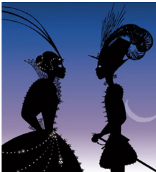
Princes et Princesses

Pionnière à ce jour inégalée, Lotte Reiniger a influencé un grand nombre de réalisateurs, notamment Michel Ocelot.